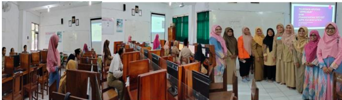
Gambar 5. Suasana Monitoring pasca pelatihan dan evaluasi kegiatan

Selama satu bulan setelah pelatihan, monitoring dilakukan secara intensif untuk melihat perkembangan penerapan Literanum oleh para guru. Monitoring ini mencakup kendala teknis, kreativitas guru dalam mengembangkan pembelajaran berbasis literasi dan numerasi, serta respon siswa terhadap materi yang disampaikan menggunakan Literanum.