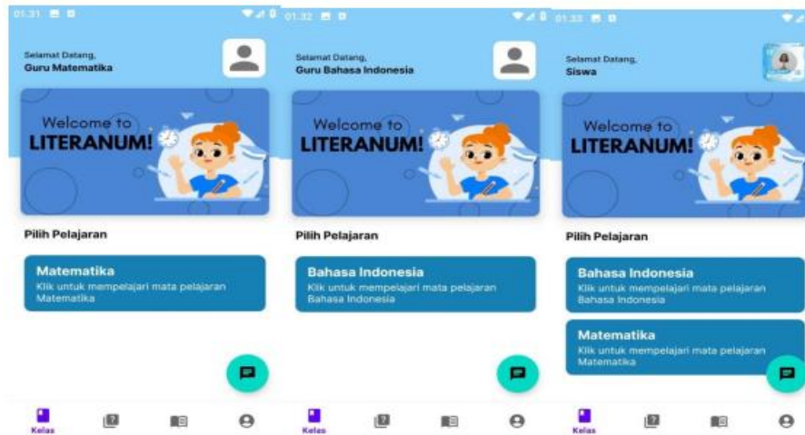
Gambar 4. Tampilan Halaman Utama aplikasi Literanum