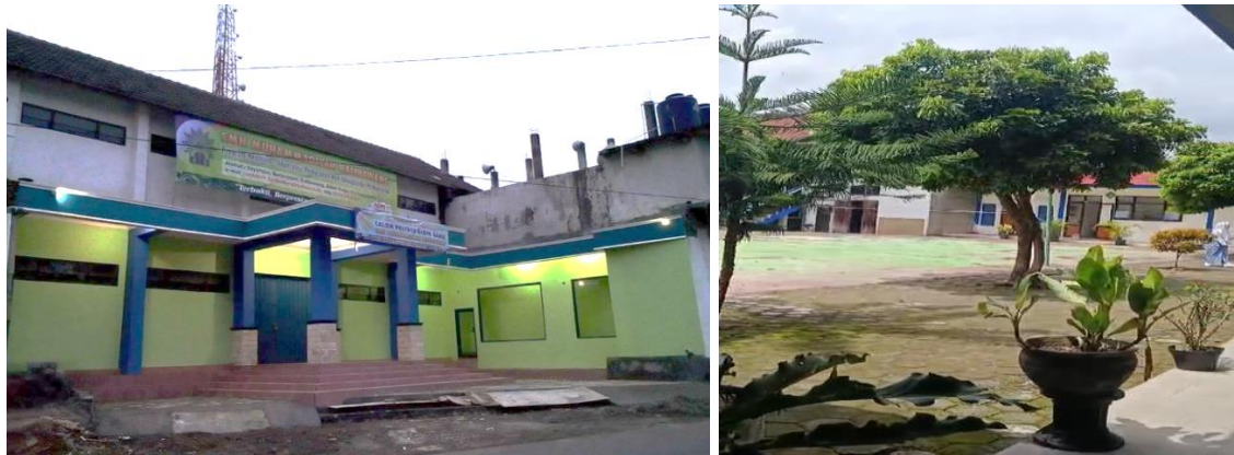
Gambar 2 Kondisi SMK Muhammadiyah Kalibawang