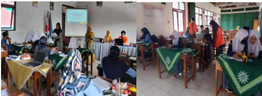
Gambar 3. Suasana Pelatihan Aplikasi Literanum di SMK Muhammadiyah Kalibawang