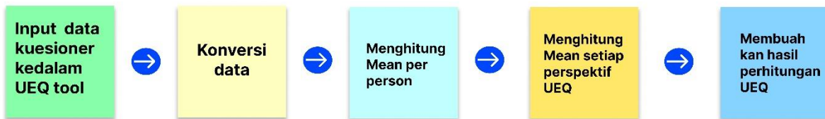
Gambar 2. Alur Pengolahan Data Tools UEQ

Pengujian user interface dilakukan melalui kuesioner yang sesuai dengan analisis data UEQ dan melibatkan 100 responden. Penilaian dilakukan dengan skala dari 1 hingga 5, di mana nilai 1 menunjukkan "sangat tidak setuju," nilai 2 "tidak setuju," nilai 3 "ragu-ragu," nilai 4 "setuju," dan nilai 5 "sangat setuju." Data dari responden tersebut kemudian diproses menggunakan alat UEQ . Hasil dari pengolahan data tersebut kemudian dianalisis untuk mendapatkan informasi tentang pengalaman pengguna dalam menggunakan sistem informasi akademik mahasiswa Proses pengolahan data dapat terlihat pada Gambar 2.