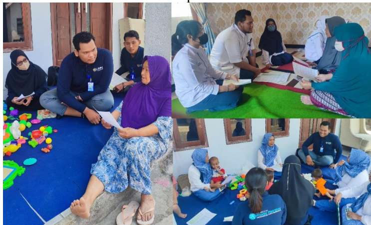
Gambar 2. Dokumentasi Kegiatan Penyuluhan

Kegiatan sosialisasi tekanan darah tinggi yang dilakukan di Posyandu kepada masyarakat di Kecamatan Tumpang berjalan lancar dan tanpa insiden. Respon baik didapat dari 22 masyarakat yang datang saat materi dipresentasikan. Pada saat penyuluhan, masyarakat yang hadir mendengarkan materi dengan seksama. Materi penyuluhan meliputi pengertian, gejala, penyebab, pencegahan dan manfaat senam di rumah untuk permasalahan tekanan darah tinggi.