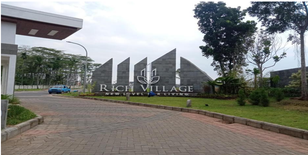
Gambar 1. Maingate Proyek Rich Village

Kegiatan penjualan dapat dilaksanakan dengan baik jika didukung oleh sistem penjualan yang memadai. Sistem penjualan yang memadai ini akan menghasilkan informasi penting yang diperlukan oleh pimpinan dalam mengambil keputusan yang tepat bagi kemajuan perusahaan. Dalam suatu sistem penjualan berisikan tentang informasi bagaimana kegiatan tersebut dilaksanakan, dokumen apa saja yang diperlukan dalam pelaksanaan penjualan, serta pihak mana saja yang berwenang mengotorisasi kegiatan penjualan tersebut. Sistem informasi akuntansi merupakan serangkaian kegiatan yang terdiri dari transaksi penjualan barang atau jasa baik secara kredit maupun secara tunai (Mulyadi, 2016:160). Penjualan secara tunai itu berarti menjual barang dengan ketentuan uang langsung dibayarkan secara cash atau lunas, sedangkan penjualan secara kredit itu berarti menjual barang dengan memberi uang muka dahulu atau tidak menggunakan uang muka sama sekali dan sisa pembayaran akan dibayar berangsur-angsur sampai dengan waktu yang ditentukan (Chairiyah, 2014 : 23).