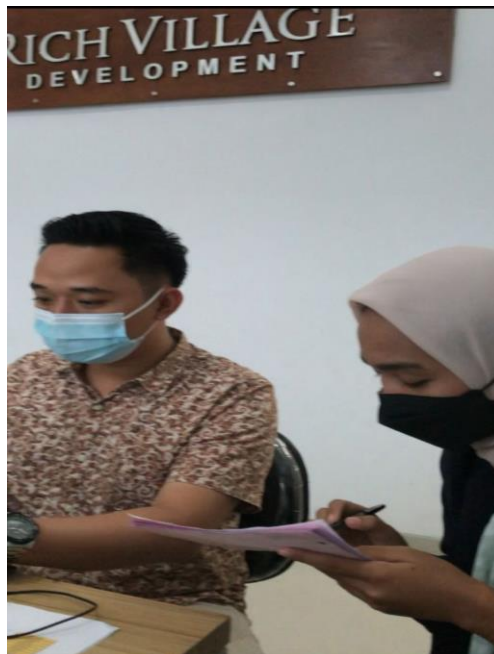
Gambar 3. Pendampingan dan pelatihan

Setelah persiapan selesai tim membantu membuat pembagian tugas dan tanggung jawab setiap bagian, bagian-bagian yang terikat dengan sistem penjualan kredit, dokumen yang digunakan, catatan yang digunakan, dan jaringan prosedur yang membentuk sistem penjualan kredit seperti dibawah ini: