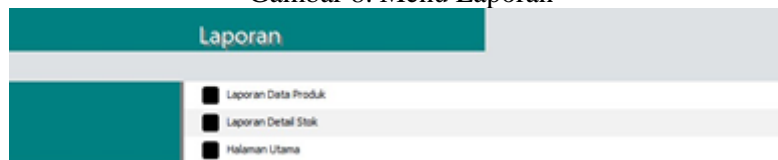
Gambar 8. Menu Laporan

Menu laporan adalah menu yang berisi berbagai jenis laporan yang berkaitan dengan bisnis, seperti laporan keuangan, penjualan, pembelian, dan lain-lain (runsystem, 2022). Laporan data produk adalah laporan yang menampilkan informasi tentang produk yang dijual, seperti nama, harga, kategori, dan lain-lain (Erwana, 2023). Laporan detail stok adalah laporan yang menampilkan jumlah stok atau persediaan barang yang dimiliki di gudang secara fisik (Anggraina, 2022). Laporan ini berguna untuk mengontrol persediaan, menghindari kekurangan atau kelebihan stok, dan mengetahui kinerja penjualan produk (microsoft, 2021).