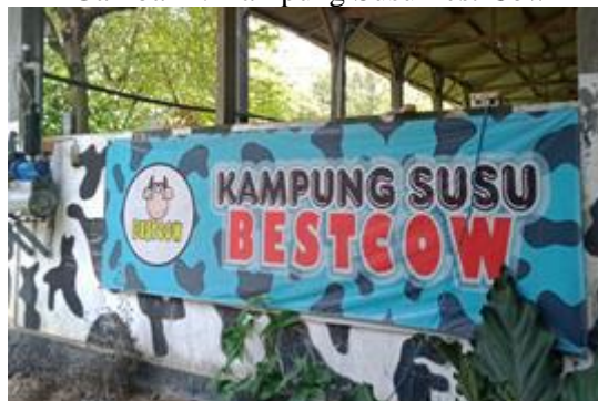
Gambar 1. Kampung Susu Best Cow

Metode pelaksanaan kegiatan pengabdian dimulai dari tahap persiapan koordinasi tim dan mitra, mengunjungi lokasi Best Cow Farm Ajung Jember , lalu melakukan pengumpulan data serta informasi dari pegawai Best Cow Farm Ajung Jember . Teknik perolehan data dengan cara wawancara dan dokumentasi kepada pegawai Best Cow Farm Ajung Jember . Melakukan pengamatan selama berada di lingkungan Best Cow Farm Ajung Jember .