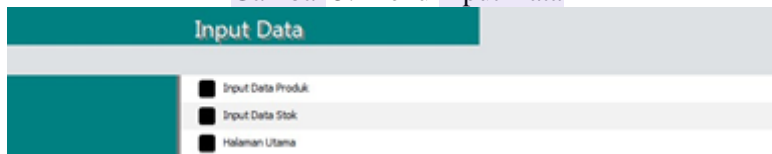
Gambar 5. Menu Input Data

Input data produk dan input data stok adalah dua hal yang berbeda tetapi saling berkaitan. Input data produk adalah proses memasukkan informasi tentang produk yang dijual oleh suatu bisnis atau perusahaan ke dalam komputer atau program perangkat lunak (Ad-Ins, 2022). Menurut Sia (2022), Input data stok adalah proses menghitung jumlah barang yang tersedia di gudang secara fisik. Kegunaan dari input data produk dan input data stok adalah untuk memudahkan pengelolaan persediaan barang, meningkatkan efisiensi operasional, dan mencegah kekurangan atau kelebihan stok (Ramadhani, 2021).