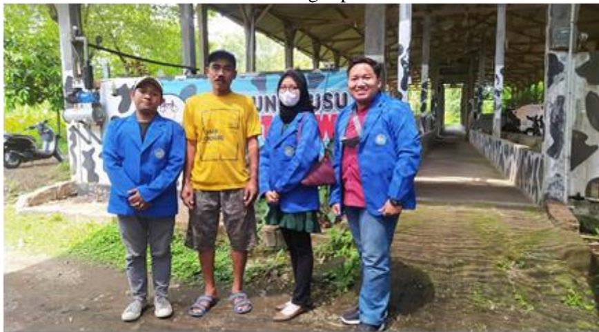
Gambar 3. Lokasi kandang sapi di Best Cow Farm

Pegawai di Best Cow Farm Ajung Jember mengatakan bahwa sapi-sapi disana mengonsumsi rumput dan konstat sebagai makanannya, dikarenakan jika mengonsumsi ampas tahu maka susu yang dihasilkan mudah pecah dan warnanya cukup berbeda.