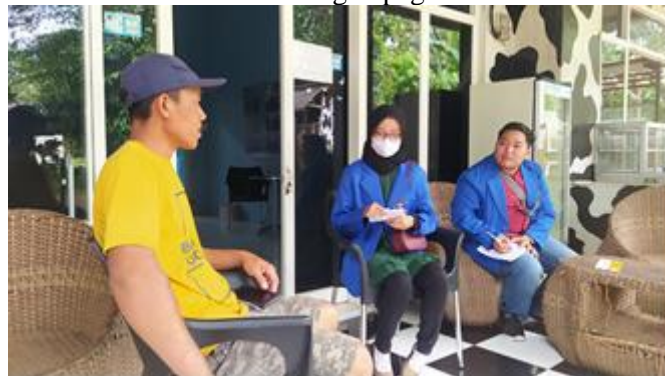
Gambar 2. Wawancara dengan pegawai Best Cow Farm

Laporan hasil pengabdian di Best Cow Farm Ajung Jember melalui proses wawancara dengan pegawai maka di dapatkan beberapa informasi yaitu Best Cow Farm Ajung Jember memiliki sapi indukan 10 ekor dan sapi anakan 10 ekor. Untuk pemerahan susu sapi hanya dilakukan dua kali dalam satu hari, yaitu pagi dan sore. Teknik pemerahan sapi dilakukan dengan menggunakan teknik mesin, setiap sapi memerlukan kurang lebih 10 menit dalam proses pemerahan dan hanya terdapat dua mesin untuk pemerahan susu sapi. Jumlah susu yang dihasilkan yaitu 80 liter/hari. Best Cow Farm Ajung Jember tidak hanya menjual susu murni saja, akan tetapi juga menjual susu dan yoghurt rasa-rasa. Selain itu juga menyediakan wisata edukasi bagi para pelajar. Namun, dalam 2 tahun terakhir ini kegiatan wisata edukasi Best Cow Farm Ajung Jember tutup untuk sementara waktu. Hal tersebut disebabkan oleh pandemi Covid 19, sehingga kegiatan peternakan Best Cow Farm Ajung Jember saat pandemi Covid 19 hanya berfokus pada produksi susu dan yogurt. Adanya wabah PMK juga berdampak pada manajemen perusahaan yang akhirnya harus mulai ditata kembali. Susu sapi sementara ini masih disalurkan melalui distributor, sehingga jika konsumen ingin membeli dalam jumlah yang banyak harus memesan terlebih dahulu.