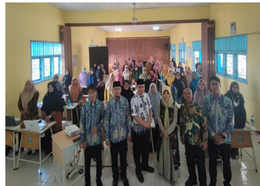
Gambar 2 Pemateri bersama LPPK Banyuwangi