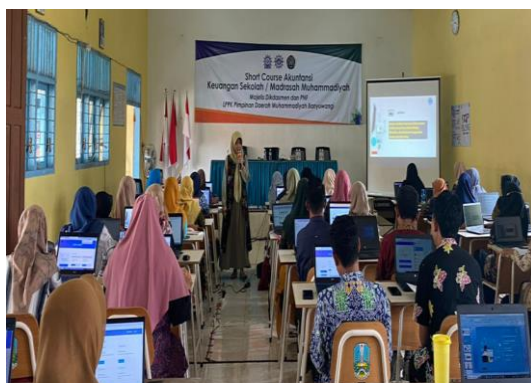
Gambar 3 Mentoring Materi Sistem Tagihan Input Awal