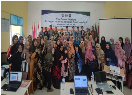
Gambar 1 Peserta bersama LPPK Banyuwangi dan Pemateri

menghambat dalam proses mentoring. Materi yang disampaikan harus runtun dan komprehensif disampaikan kepada. Materi yang disampaikan antara lain system tagihan input awal, system tagihan transaksi-report-setting dan yang terakhir diadakan post test untuk mengukur kemampuan peserta SCA dalam mengikuti mentoring serta bahan evaluasi dalam penyampaian materi.