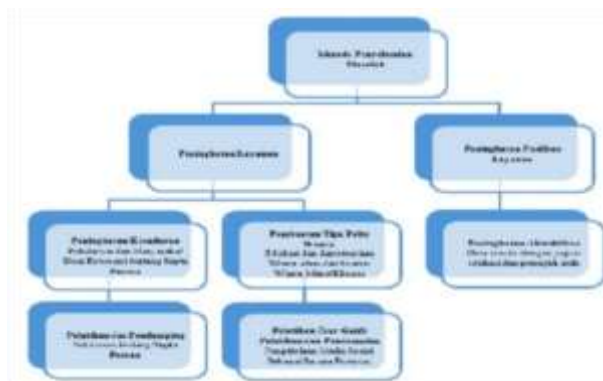
Gambar 1. Metode pendekatan dan penerapan teknologi dan inovasi