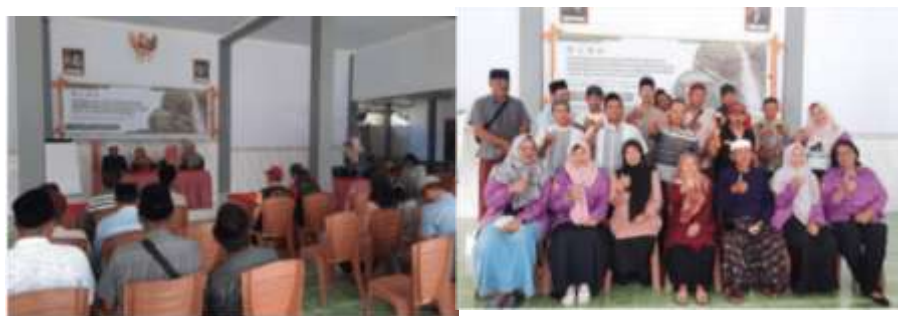
Gambar 4. Berbagai Pelatihan Untuk Pokdarwi