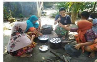
Gambar 5. Interaksi wisatawan dengan warga local Desa Lantan

Di sisi lain, ketika Pokdarwis Desa Lantan menjual destinasi wisata, juga melibatkan warga setempat untuk mendukung kearifan local desa. Hal ini bertujuan untuk memperkenalkan aktivitas-aktivitas yang dilakukan oleh warga untuk bisa dinikmati oleh wisatawan. Tujuan dari kegiatan tersebut adalah membina hubungan yang hangat antara warga dengan wisatawan, sehingga tidak ada jarak untuk bisa saling mengenal dan memahami budaya yang berbeda. Hal tersebut dapat dilihat melalui gambar di bawah ini.