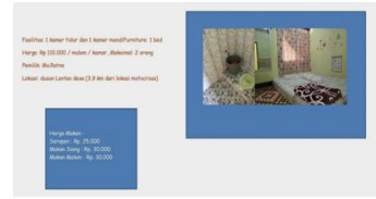
Gambar 4. Homestay Di Desa Wisata Lantan

Pokdarwis Desa Wisata Lantan menawarkan akomodasi penginapan di rumah warga dengan harga terjangkau, sehingga wisatawan tidak kesusahan untuk melakukan trip beberapa hari. Hal tersebut dapat dilihat melalui gambar di bawah ini.