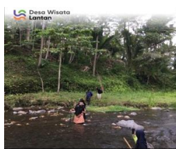
Gambar 3. Soft Tracking Desa Wisata Lantan

Destinasi wisata yang dimiliki oleh Desa Wisata Lantan bukan hanya atraksi saja, melainkan juga wisata alam. Pokdarwis Desa Lantan memberikan wawasan kepada wisatawan untuk bisa mengolah hasil bumi dan menjaga ekosistem alam dengan aktivitas yang unik dan belum pernah dirasakan oleh wisatawan, khususnya wisatawan asing. Menjaga ekosistem alam dapat dilakukan oleh wisatawan dengan kegiatan soft tracking. Hal tersebut seperti dokumentasi