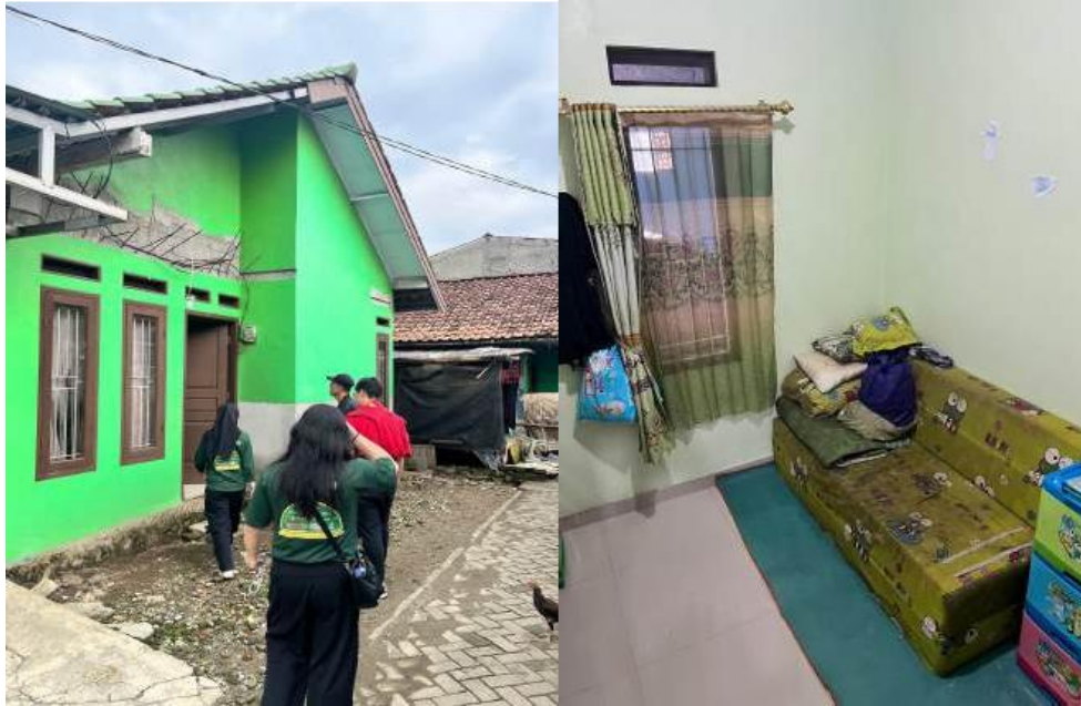
Gambar 4.1. Kondisi Rumah Calon Homestay di Ranca Indah