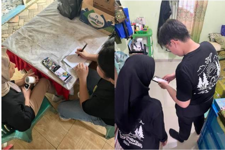
Gambar 4.2. Membuat Konsep Pengembangan Homestay