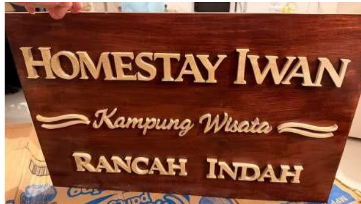
Gambar 4.3. Papan Kayu Calon Homestay Rumah Pak Iwan