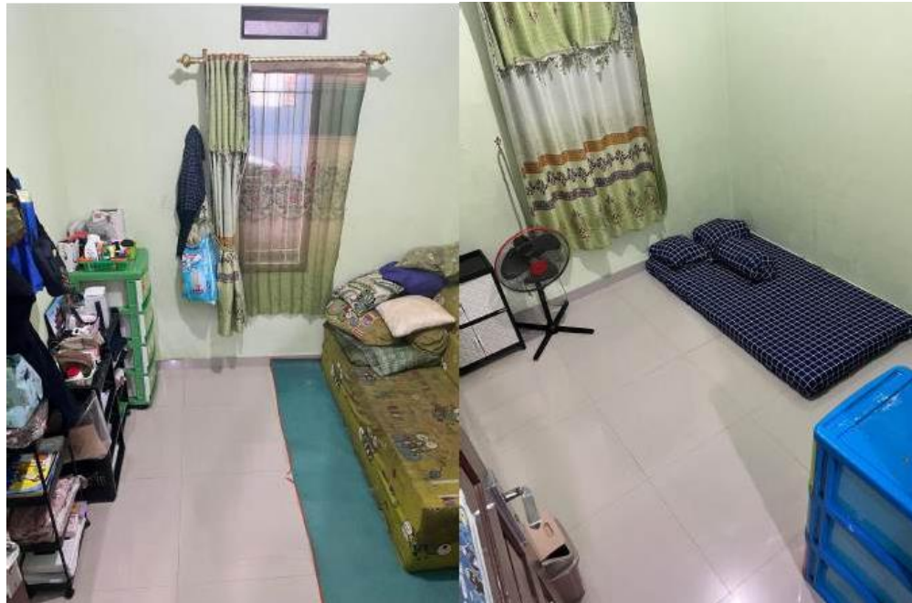
Gambar 4.4. Perbandingan Kondisi Kamar Calon Homestay Sebelum dan Sesudah Penataan