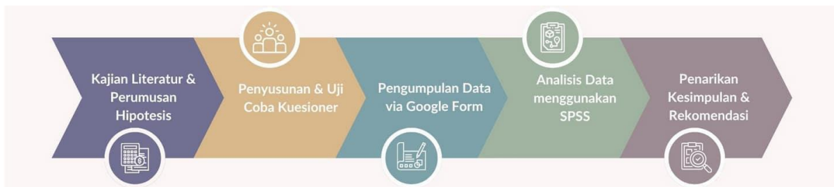
Gambar 1. Prosedur Penelitian