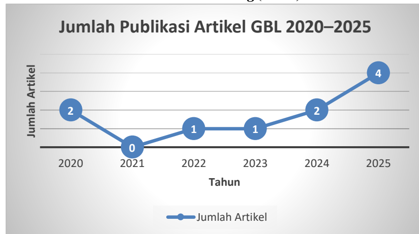
Gambar 2. Jumlah Publikasi Artikel GBL pada Tahun 2020–2025

Berdasarkan hasil kajian pustaka, diperoleh enam tahun pengamatan publikasi artikel terkait Game-Based Learning (GBL) dari tahun 2020 hingga 2025. Pada tahun 2020 terdapat dua artikel yang membahas topik GBL, sementara pada 2021 tidak ditemukan publikasi terkait. Tahun 2022 dan 2023 menunjukkan jumlah