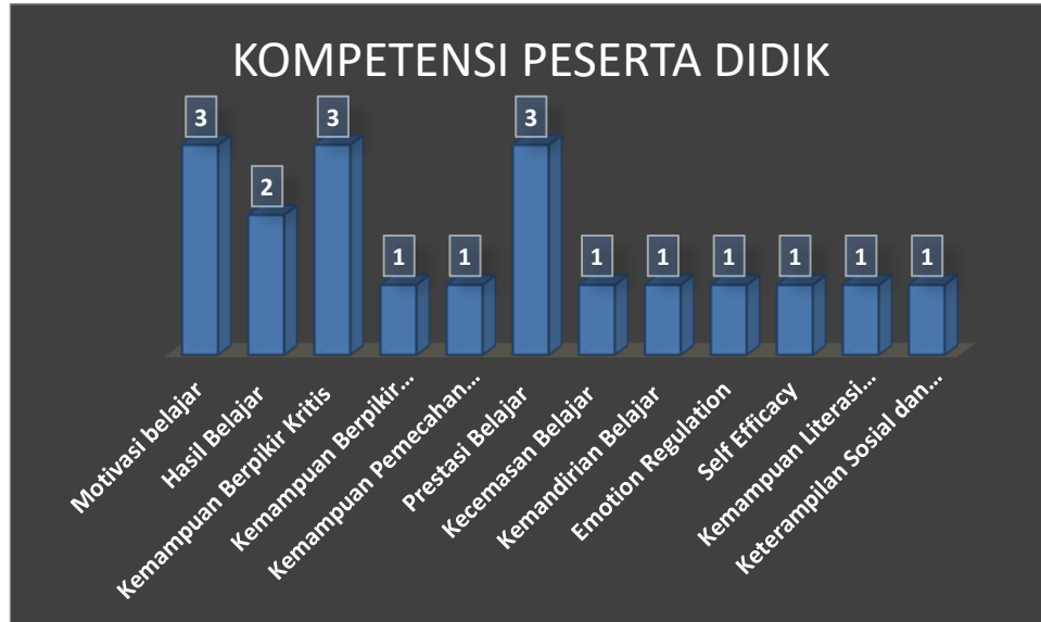
Gambar 4. Kompetensi yang diteliti menggunakan Game-Based Learning

Gambar 4 diagram batang menggambarkan berbagai kompetensi peserta didik yang diteliti melalui penerapan Game-Based Learning . Dari total artikel yang dikaji, diperoleh hasil bahwa motivasi belajar, kemampuan berpikir kritis, dan prestasi belajar merupakan kompetensi yang paling banyak diteliti, masing-masing sebanyak 3 penelitian (16%). Selanjutnya, hasil belajar diteliti dalam 2 penelitian (11%). Adapun kompetensi lain seperti kemampuan berpikir kreatif, kemampuan pemecahan masalah, kecemasan belajar, kemandirian belajar, regulasi emosi, self-efficacy , kemampuan literasi dan numerasi, serta keterampilan sosial dan motorik masing-masing diteliti sebanyak 1 penelitian (5%). Berdasarkan hasil tersebut, dapat disimpulkan bahwa kompetensi yang paling banyak dikaji menggunakan Game-Based Learning adalah motivasi belajar, kemampuan berpikir kritis, dan prestasi belajar karena ketiganya memperoleh proporsi tertinggi dibandingkan dengan kompetensi lainnya.