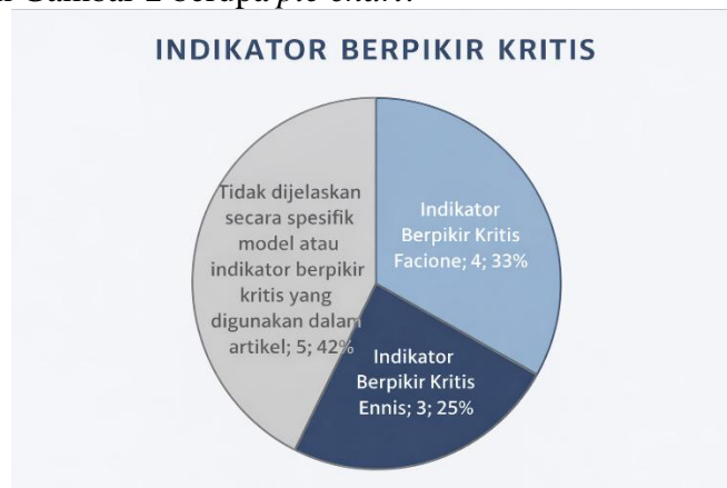
Gambar 2. Model atau Indikator Berpikir Kritis yang digunakan dalam 12 artikel

Berdasarkan 12 artikel yang di review indikator berpikir kritis Facione merupakan indikator berpikir kritis yang paling banyak digunakan dalam pembelajaran matematika baik di jenjang SMP dan SMA. Dari 12 artikel yang di analisa terdapat 4 artikel yang dalam penelitiannya indikator berpikir kritis model Faciona, kemudian terdapat 3 artikel yang dalam penelitiannya indikator berpikir kritis model Ennis serta ada 5 artikel yang tidak menjelaskan secara spesifik model berpikir kritis yang digunakan. Berikut merupakan data artikel penelitian yang disajikan dalam Gambar 2 berupa pie chart .