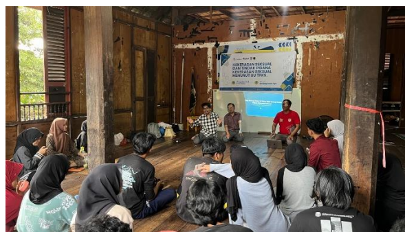
Gambar 3. Pelaksanaan Pelatihan