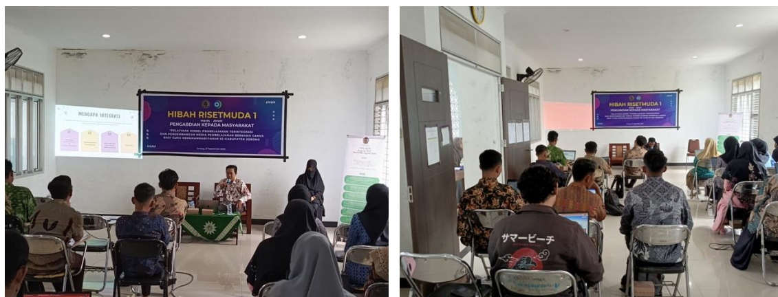
Gambar 1. Dokumentasi Pelaksanaan Kegiatan Pelatihan

Kedua, Selain kegiatan pelatihan untuk guru Kemuhammadiyah, tim pelaksana juga berupaya memassifikasi eksistensi ORTOM wajib di sekolah Muhammadiyah dengan cara berkomunikasi dan