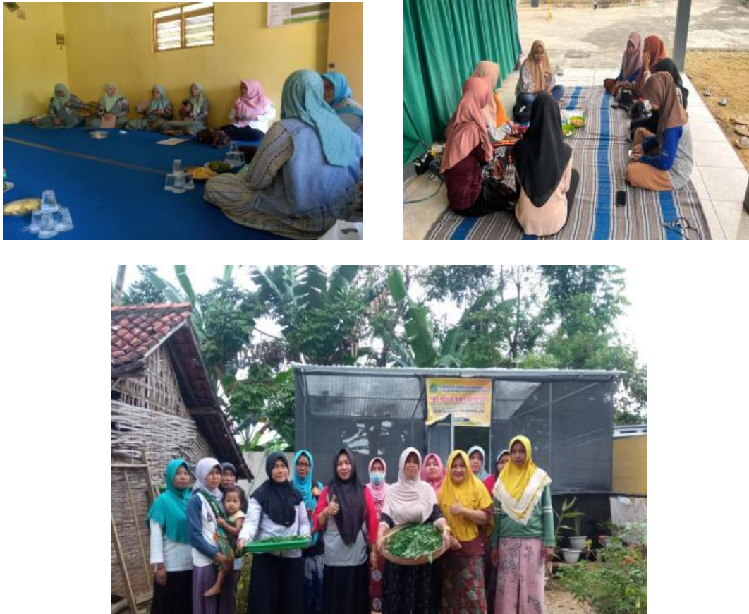
Gambar 1. Sosialisasi Materi Diversifikasi Olahan Daun Kelor Menjadi Dendeng Daun Kelor pada Kelompok Ibu-Ibu PKK di Desa Samatan

Pembahasan juga mencakup prinsip-prinsip dasar serta langkah-langkah pelaksanaan diversifikasi olahan pangan dari daun kelor menjadi dendeng daun kelor. Dijelaskan bahwa keberhasilan produk dendeng daun kelor tergantung pada tiga faktor utama: komposisi campuran daun kelor dan tepung, intensitas penjemuran yang tepat, serta teknik pengolahan yang benar.