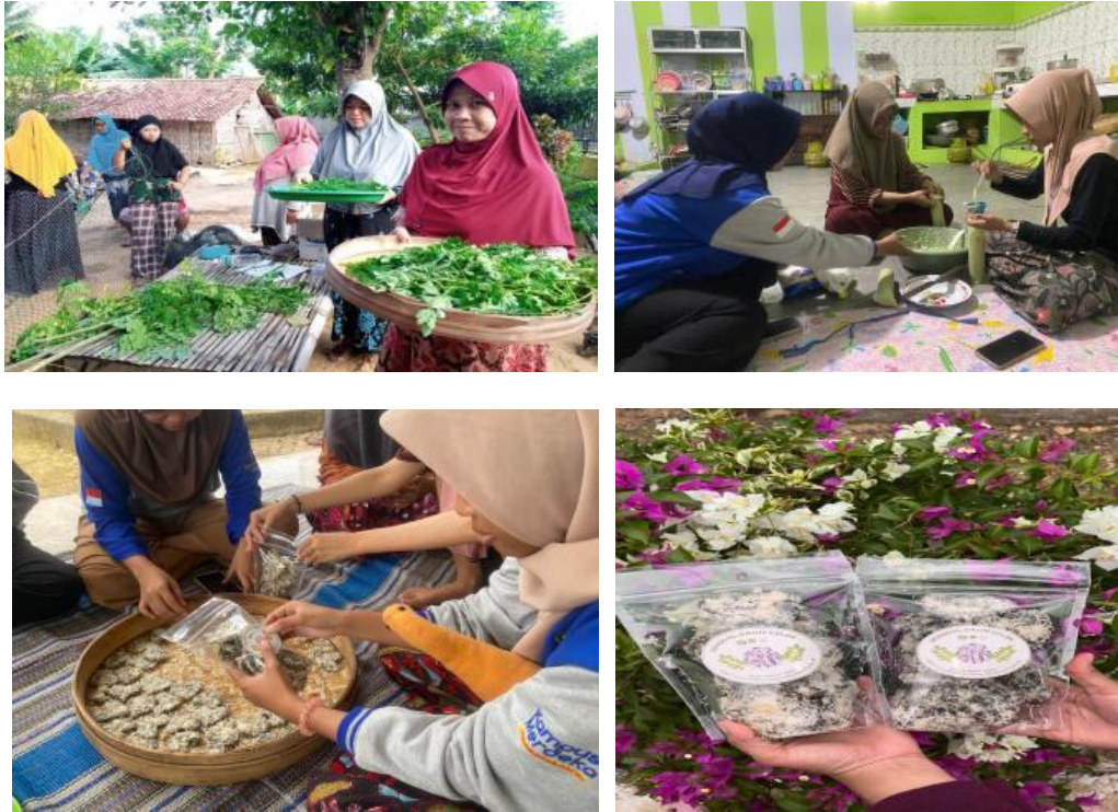
Gambar 3. Kegiatan Praktik Diversifikasi Olahan Daun Kelor Menjadi Dendeng Daun Kelor pada Kelompok Ibu-Ibu PKK di Desa Samatan

Praktik secara langsung mengenai diversifikasi olahan daun kelor menjadi dendeng daun kelor mendapat sambutan yang cukup positif dari anggota Kelompok Ibu-Ibu PKK di Desa Samatan yang bertindak sebagai peserta, sehingga praktik dapat berlangsung dengan lancar. Tingkat pemahaman peserta terhadap kegiatan praktik diversifikasi olahan daun kelor menjadi dendeng daun kelor ditampilkan pada Gambar 4. Dalam Gambar 4 tersebut terlihat bahwa sebelum pelatihan dilaksanakan, rata-rata skor pemahaman peserta adalah 1,35. Setelah mengikuti pelatihan, rata-rata skor pemahaman peserta meningkat secara signifikan menjadi 2,33 atau mengalami kenaikan sebesar 98,40%. Hal ini mengindikasikan bahwa kegiatan pengabdian kepada masyarakat dalam bentuk praktik langsung berhasil meningkatkan pengetahuan dan keterampilan peserta dalam diversifikasi olahan daun kelor menjadi dendeng daun kelor.