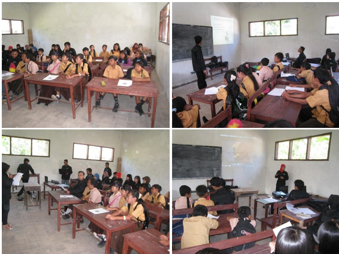
Gambar 2. Suasana Pelatihan

Secara keseluruhan, kegiatan ini berhasil mencapai tujuannya dalam menumbuhkan kesadaran etika digital, meningkatkan kemampuan berpikir kritis terhadap informasi daring, serta menumbuhkan komitmen siswa untuk menggunakan media sosial secara positif dan bertanggung jawab.