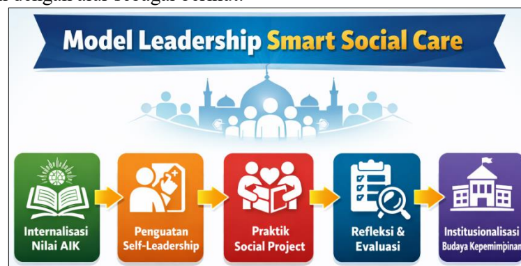
Gambar 2. Model Leadership Smart Social Care

Berdasarkan hasil implementasi, model Leadership Smart Social Care yang dikembangkan menunjukkan bahwa keberhasilan program tidak hanya ditentukan oleh pelatihan, tetapi oleh praktik nyata dan refleksi berkelanjutan dengan alur sebagai berikut: