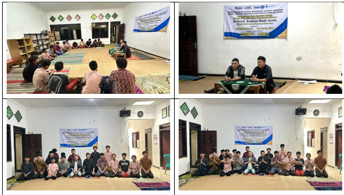
Gambar 3. Dokumentasi kegiatan PkM di Pantti Asuhan Budi Mulia Jember

Selain adanya dokumen kegiatan di atas sebagai bukti empiris, pendampingan juga dilakukan melalui kajian terdahulu sebagai pembanding. Sehingga pembahasan dalam artikel pengabdian ini dapat lebih komprehensif dan berbasis data yang kuat. Hal ini diharapkan agar dapat memberikan gambaran yang jelas tentang efektivitas dan dampak program pendampingan Kepemimpinan Remaja Berbasis Nilai-Nilai Islam Kemuhammadiyah Di Pantti Sosial Budi Mulia Jember Sebagai Model Leadership Smart Social Care. Adapun kajian terdahulu sebagai berikut.