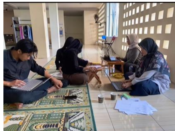
Gambar Kegiatan entri data Simam PDM Banyuwangi