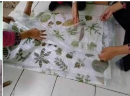
Gambar 5 Penerapan Teknik Ecoprint