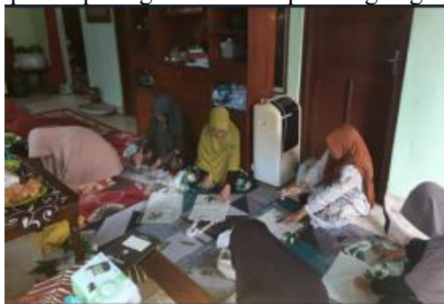
Gambar 4 Pelaksanaan Praktik ecoprint

Kualitas produk masuk kategori baik s/d sangat baik dengan nilai rata-rata 4.1. Hasil produk produk ecoprint ditampilkan pada gambar 4 sampai dengan gambar 6 berikut