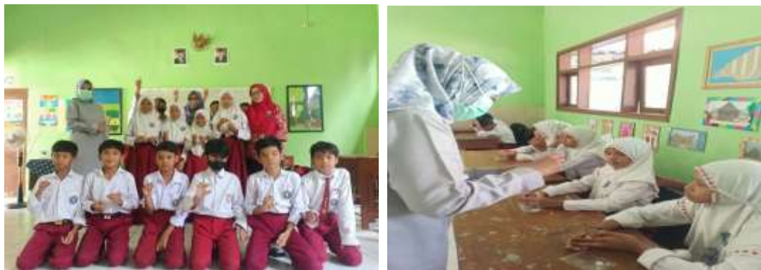
Gambar. 4 &5. Peserta pelatihan dan Pemandu

Proses pelatihan pembuatan bros dan gelang di SD Muhammadiyah 1 Balung Kabupaten Jember :