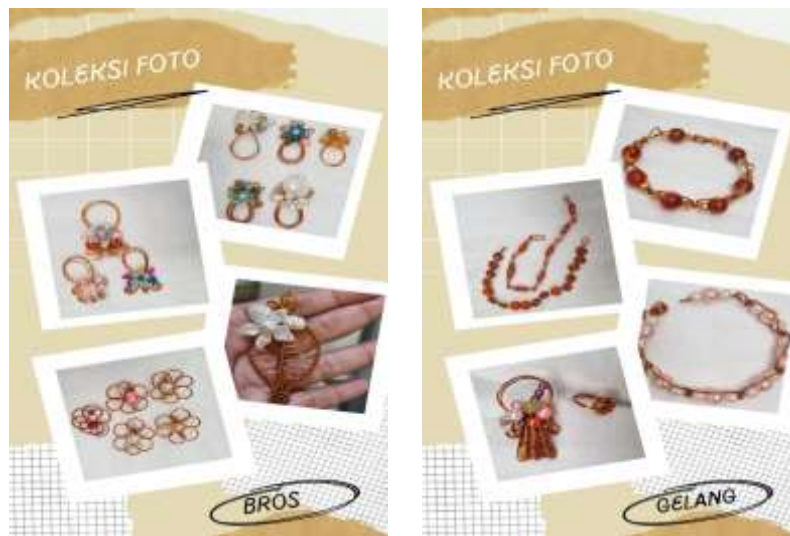
Gambar. 2 dan 3. Bros, cincin gelang, cincin

Proses pelatihan pembuatan bros dan gelang di SD Muhammadiyah 1 Balung Kabupaten Jember :