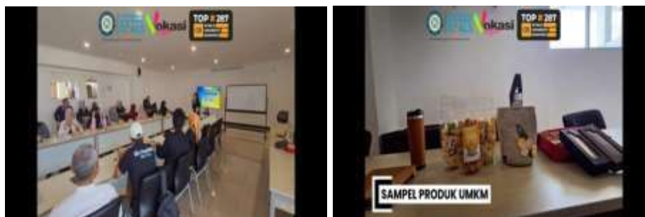
Gambar 1 & 2. Pelaksanaan Kegiatan dan Contoh Produk UMKM

Sesi pertama dilakukan oleh seorang dosen dengan mengangkat materi literasi pajak UMKM dan aktivasi Coretax. Literasi pajak yang diberikan adalah pengantar kewajiban perpajakan bagi UMKM. Namun, sebelum masuk dalam sesi materi, peserta akan diberikan sebuah pre-test untuk menguji sejauh mana pemahaman wajib pajak atas kewajiban perpajakan. Pre-test dilakukan secara bersama-sama secara serempak dengan dibantu oleh pendamping. Peserta akan diminta untuk masuk ke dalam google form untuk mengerjakan 10 soal terkait perpajakan. Berdasarkan hasil pre-test diketahui bahwa terdapat sekitar 73% peserta menjawab jawaban yang salah. Hal ini mencerminkan bahwa peserta masih belum memiliki pengetahuan perpajakan yang mumpuni sehingga pelaksanaan edukasi ini dapat tepat sasaran